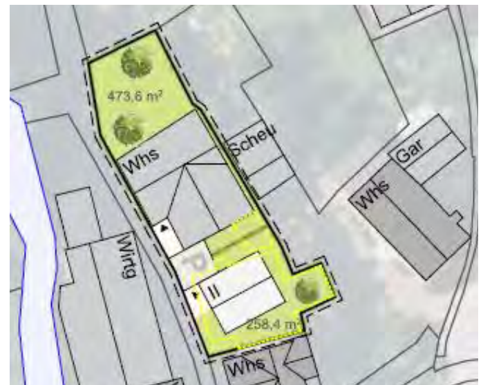
Vorentwurf Variante 2 GRUPS ARCHITEKTEN Stand 04.09.2025