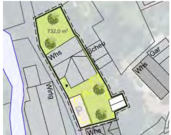
Vorentwurf Variante 1 GRUPS ARCHITEKTEN Stand 04.09.2025