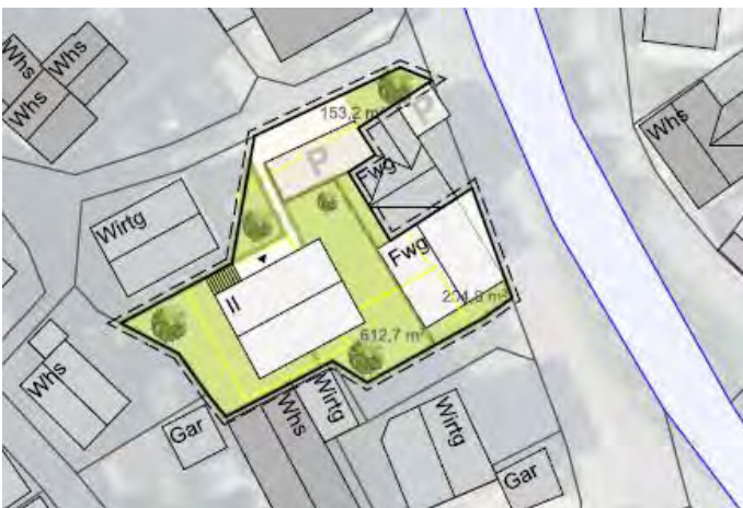
Vorentwurf Variante 1 GRUPS ARCHITEKTEN Stand 04.09.2025